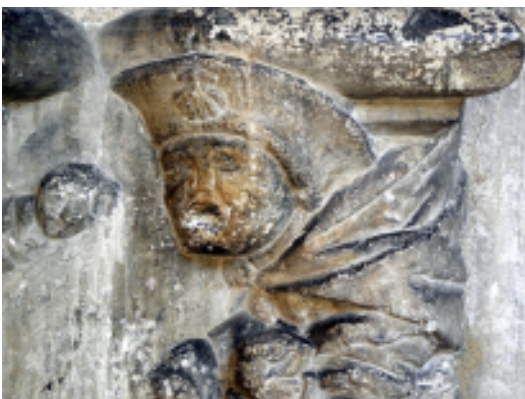
Photo ci-contre : petit pèlerin sur chapiteau - cloître de la cathédrale de Cahors.

(Bulletin de la Société des Études du Lot – 1er fascicule 2017 – janvier-mars – tome CXXXVIII)