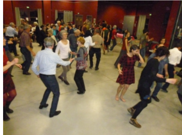
Bal de l'AG de 2017

21h : Bal traditionnel avec les AMTPcaires et tous les groupes qui se seront inscrits en journée.