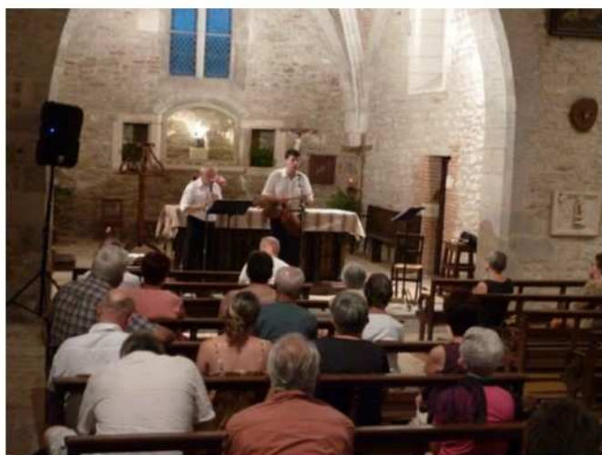
Photo du même concert, réalisée à Pradines en juillet