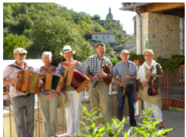
Quand Fasia Vent

Renseignements : Ostal Joan Bodon - 05 65 42 16 53 ojb12@laposte.net - www.ostal-bodon.com