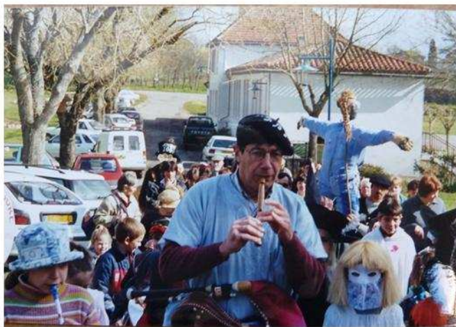
Un Carnaval ressuscité, il y a 15 ans, à Sérignac, par la directrice de l'école, après un long travail de recherche avec les enfants sur les coutumes du village.

Le renouveau actuel est sans doute liée au besoin d'animations, dans une société de loisirs toujours plus consommatrice d'activités de toutes sortes (pensons en particulier à l'irruption d'Halloween !) Mais ces carnivals sont rendus en partie possibles par le travail régulier, depuis de nombreuses années, de musiciens traditionnels, professionnels ou amateurs : professeurs et intervenants de l'ADDA, instituteurs puis professeurs d'écoles liés à notre association, travail d'autres associations bien sûr comme par exemple la Granja, bénévoles enthousiastes, pour le renouveau d'une pratique bien sympathique et très liée aux danses et musiques traditionnelles.