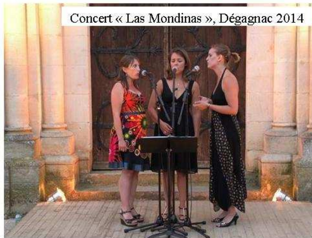
Concert « Las Mondinas », Dégagnac 2014

Renseignements au 06 84 41 55 12, à l'adresse amtpq@wanadoo.fr ou sur le site http://www.amtpquercy.com . Tract complet et fiche d'inscription sur le site.