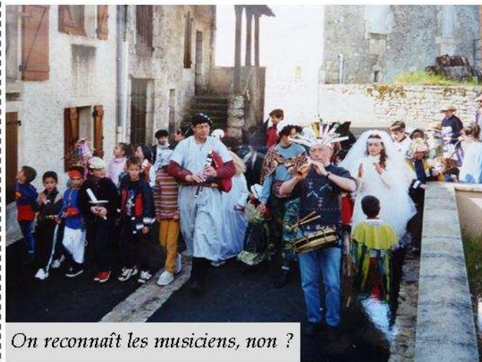
On reconnaît les musiciens, non ?

Les personnes masquées, sans être invitées, entrent dans des maisons et des cafés, ou bien simplement parcourent les Fossés (Boulevard Gambetta) et les principales rues de la ville. Le lendemain du mardi gras, il y a encore, semble-t-il, un plus grand nombre de personnes déguisées ; elles promènent par le boulevard et les rues le mannequin qui figure carnaval et qui est grotesquement accoutré ; Après des démonstrations feintes de douleur et des cris lugubres, elles brûlent le personnage, puis le jettent dans le Lot, en chantant le refrain populaire sur Pauvre carnaval dont l'idée fondamentale est la tristesse causée jadis par la succession du gras au maigre durant toute une quarantaine [période du carême, qui commence le lendemain du mardi gras].»