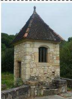
Puits couvert de Dégagnac