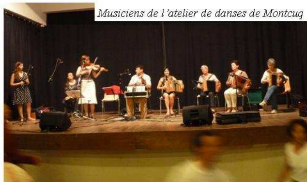
Musiciens de l'atelier de danses de Montcuq

Bal traditionnel le soir, toujours mené par ces deux formations.